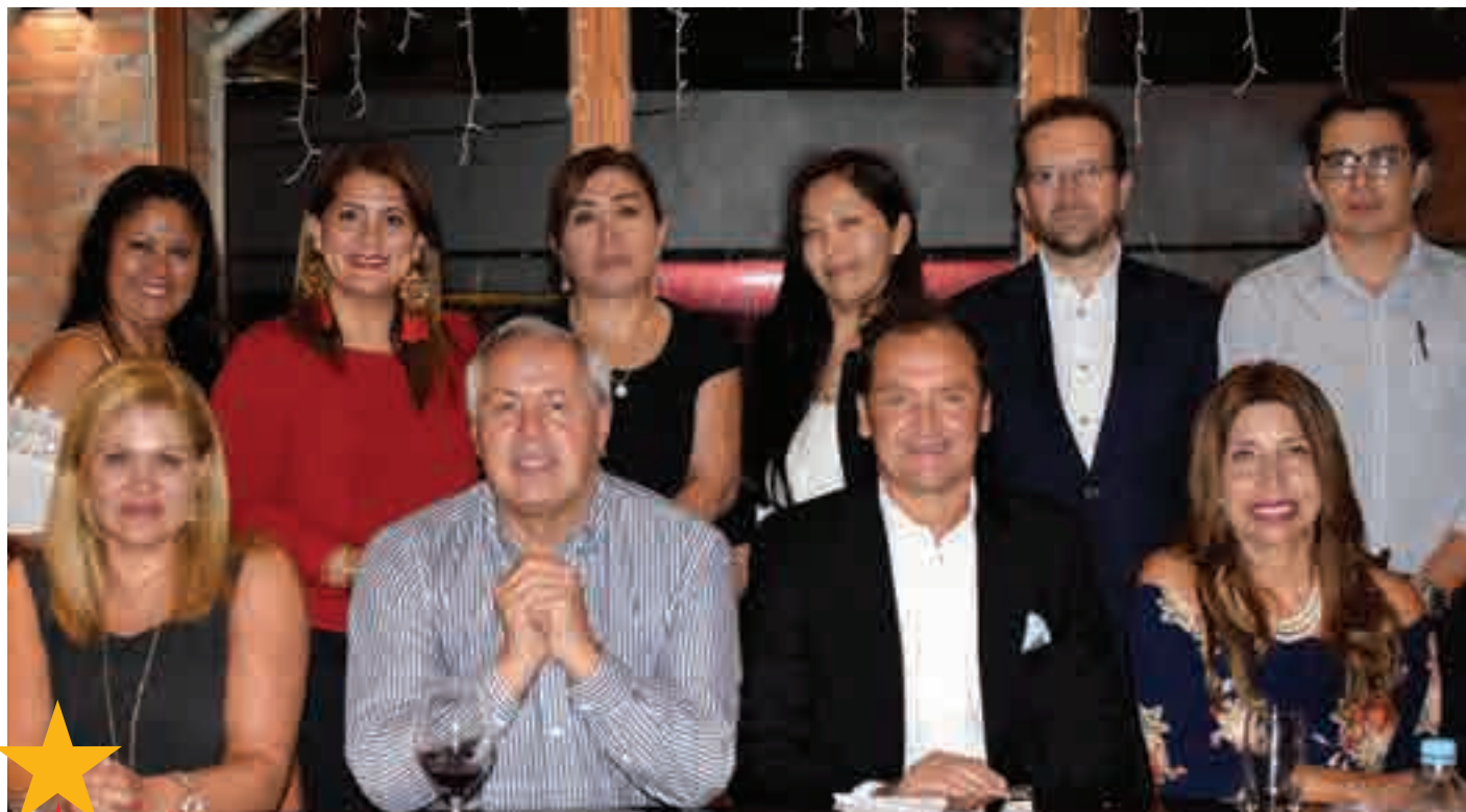
ASOEM celebra sus logros en encuentro de informe anual